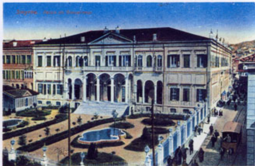
C. Deschamps, Στις Αθήνες της Μικρασίας, Τραπεζία 1991