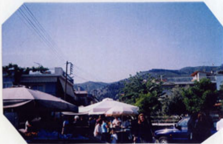
Τετάρτη, ημέρα της Συναγωγής