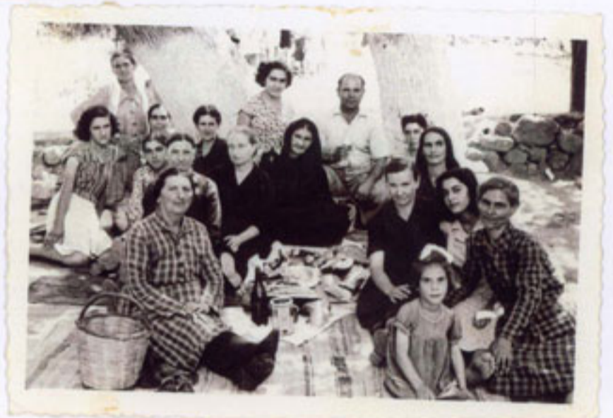
Γλέντι στον Άγιο Γιώργη Στην Παλιά Γρανίτσα.