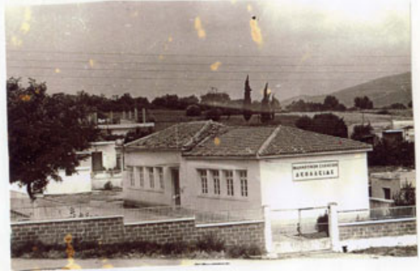
Το σχολείο διθέσιο