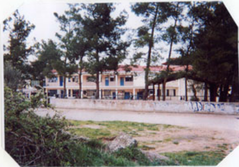
Το 5 ο Δημ. Σχ. Λιβαδειάς το 2003