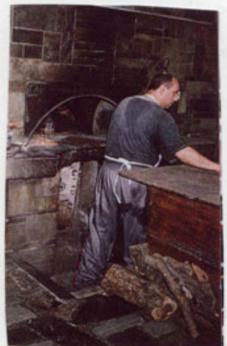
Ο φούρνος με τα ξύλα