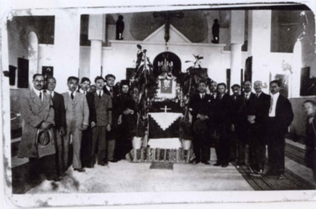
Στην εκκλησία με τη φωτογραφία του Βενιζέλου