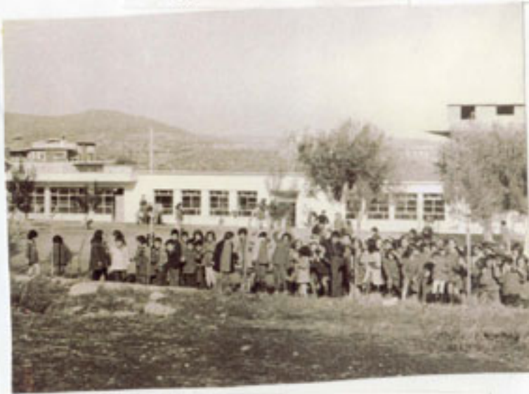
Το σχολείο το 1974