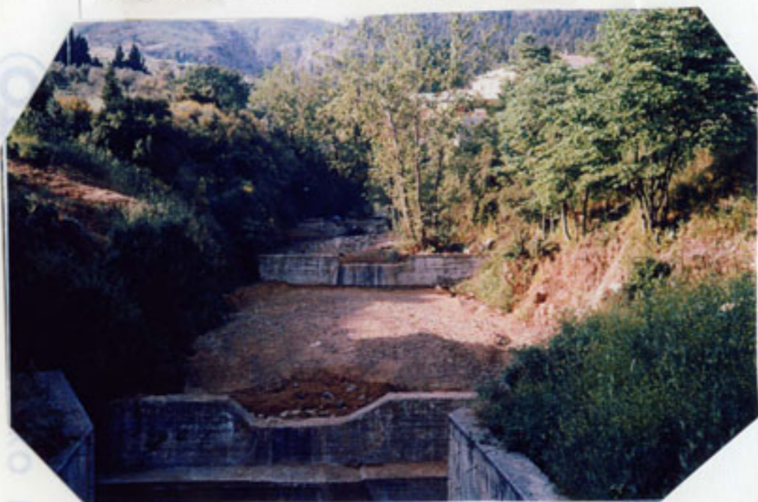
Ο χείμαρρος με αντιπλημμυρικά έργα.