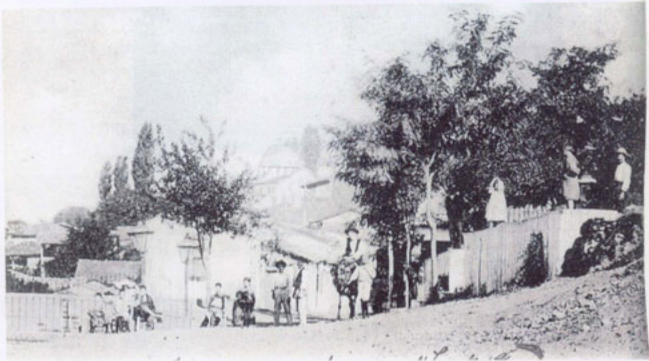
Αϊδίσι — Οδός Κεπεζί (Αρχ. Αντ. Μ.)