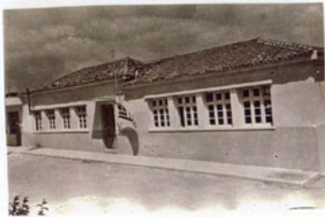
Το σχολείο ισόγειο πριν γίνει διώροφο