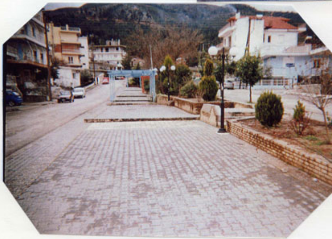
Ο χειμάρρος σκεπασμένος είναι τώρα δρόμος