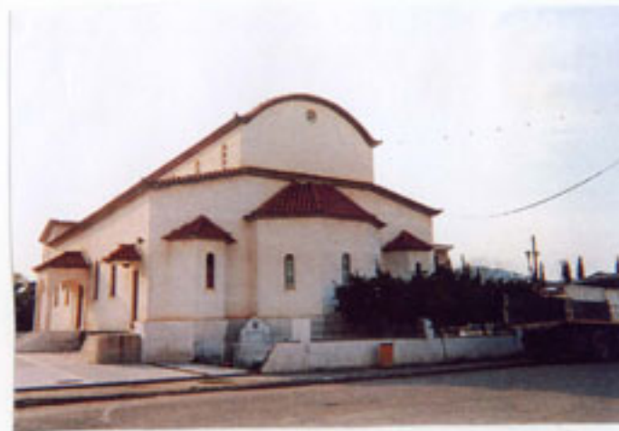
Ο Άγιος Παντελεήμονας