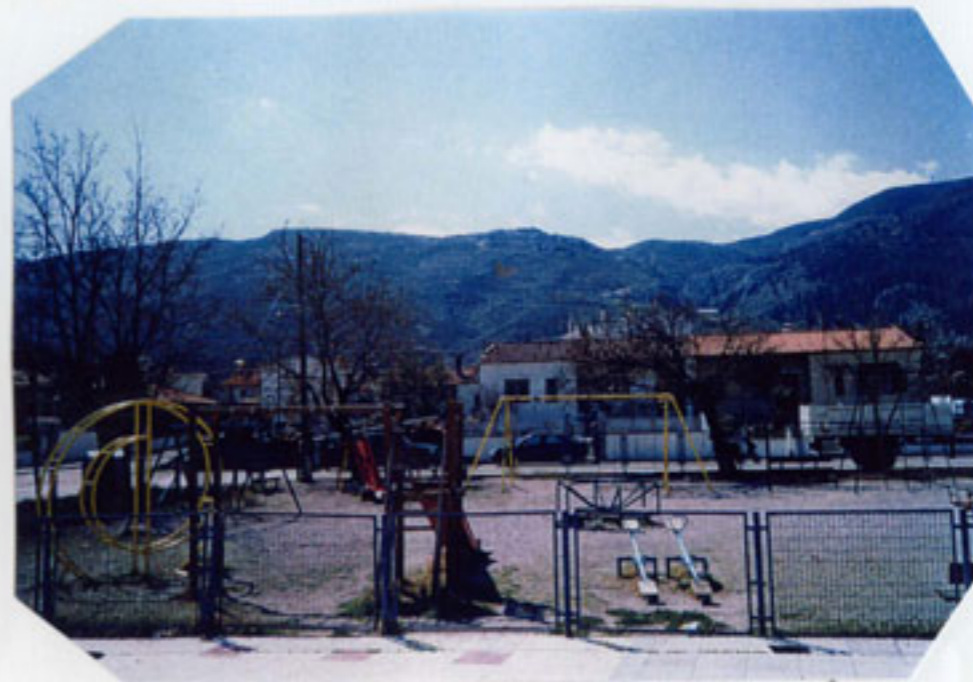
Η παιδική χαρά