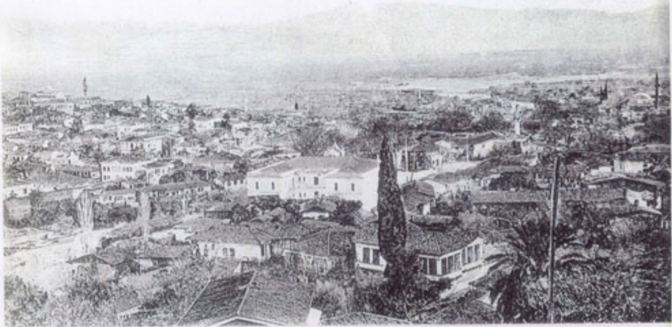
Γενική άποψη του Αιδινίου (Αρχ. Αντ. Μ.)