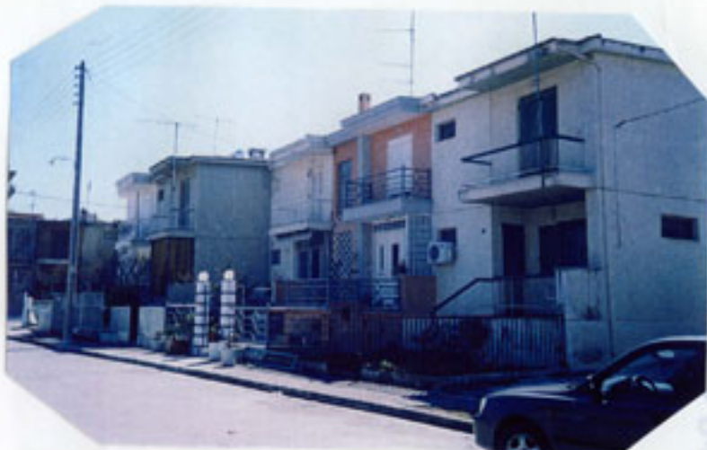
Διώροφες εργατικές κατοικίες