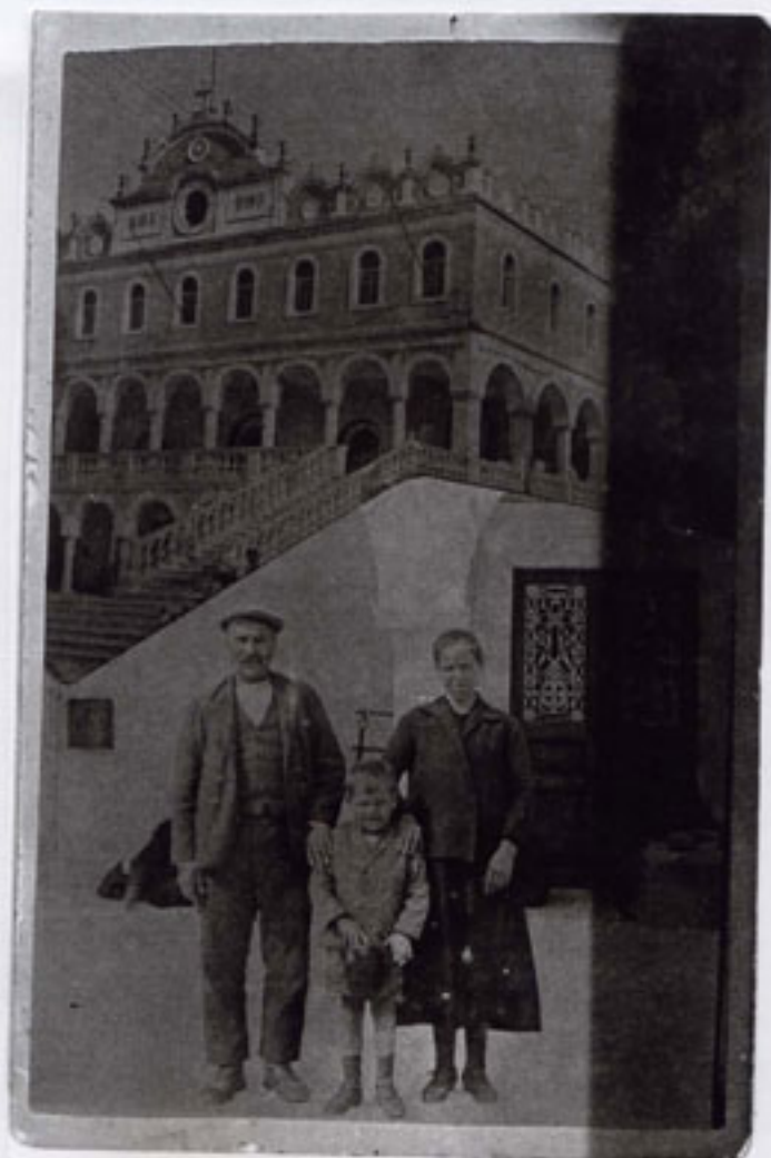
Τις ελπίδες τους οι πρόσφυγες τις στήριζαν στην Παναγιά της Τήνου