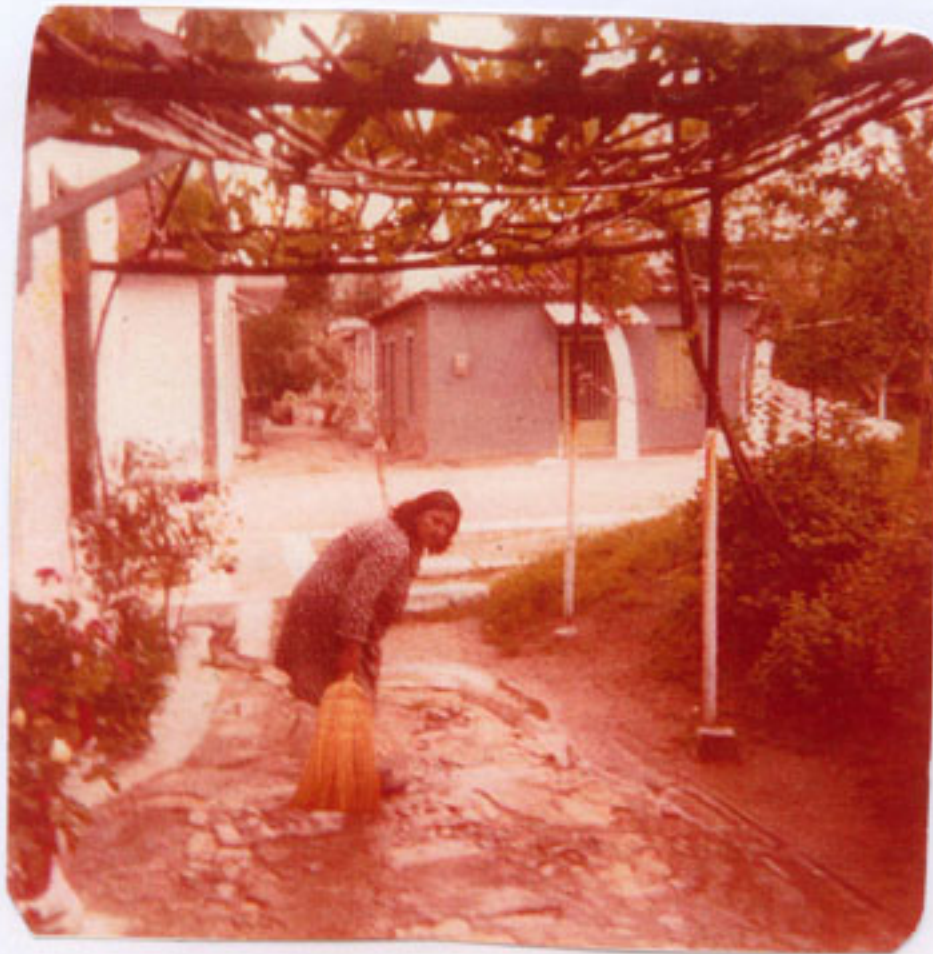
Ασπρισμένες αυλές και πρεβάζια