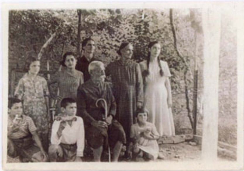
Τα εγγόνια με τον παππού που φορά τη μικρασιάτικη βράκα.