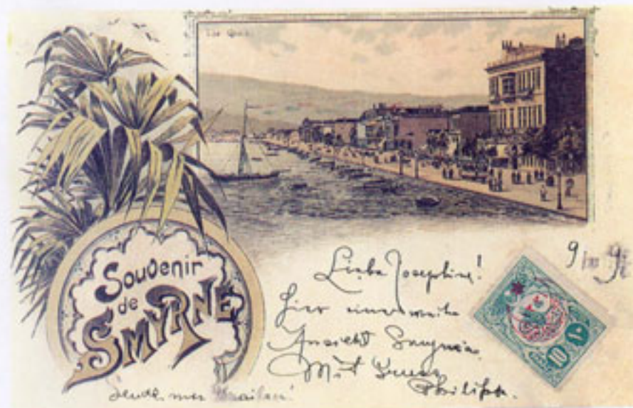
C. Deschamps, Στις Αθήνες της Μικρασίας, Τραπεζία 1991