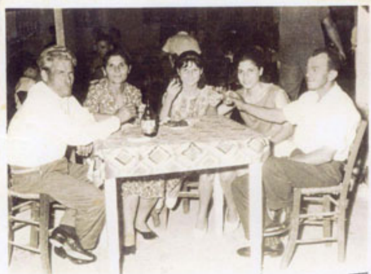
Μ' ένα μπουκάλι κρασί στο ταβερνάκι.