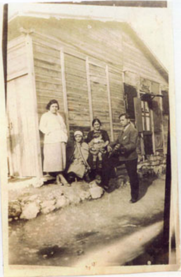
Στιγμές από τη ζωή των ανθρώπων στα Σόκια.