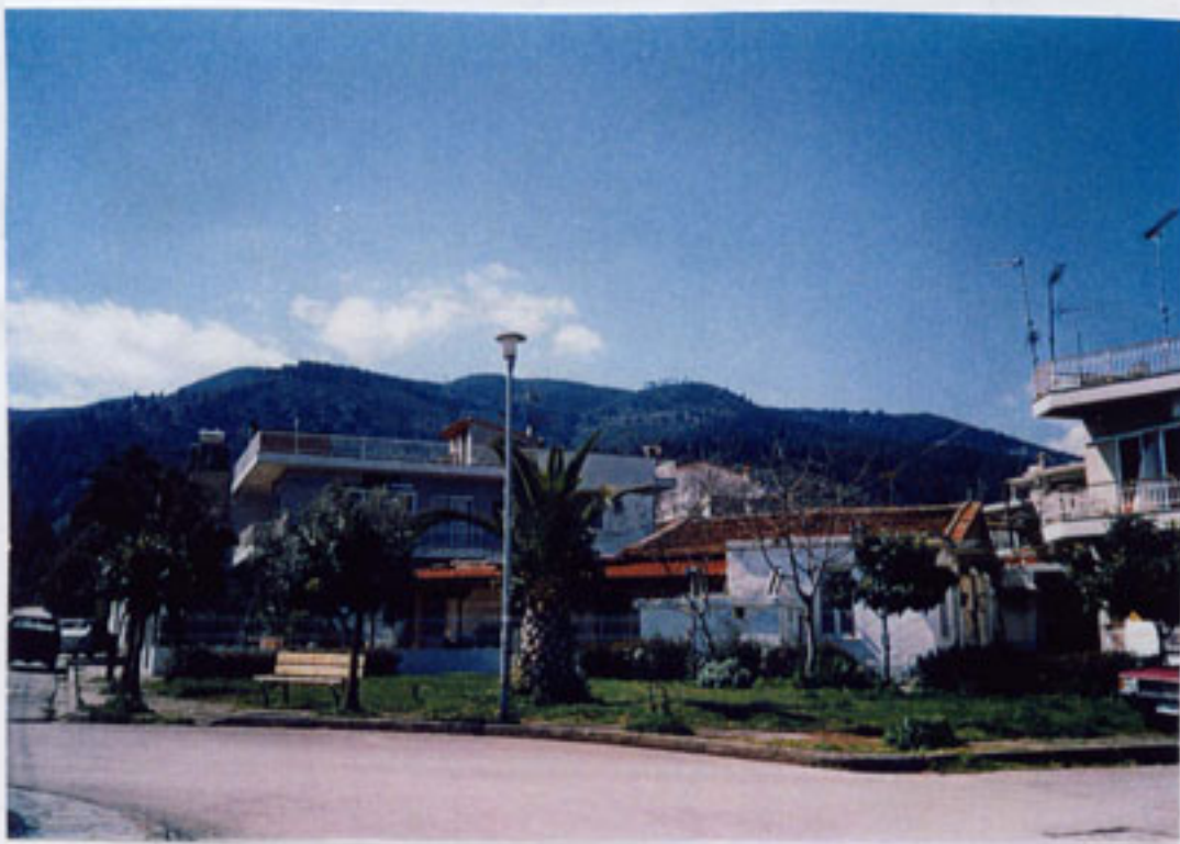
Η πλατεία της Ειρήνης