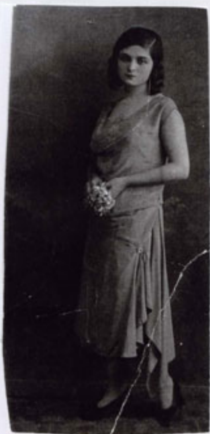
Μικρασιάτισσα της εποχής