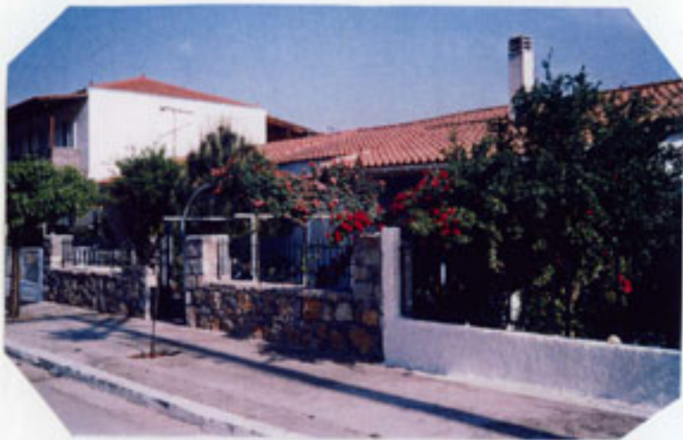
Το τρίτο ισόγειο σπλίτ έγινε διώροφο