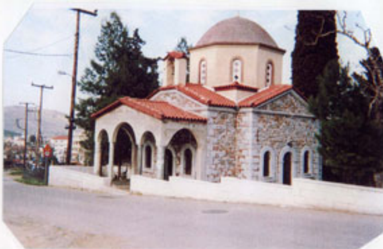
Ο Άγιος Μελέτιος