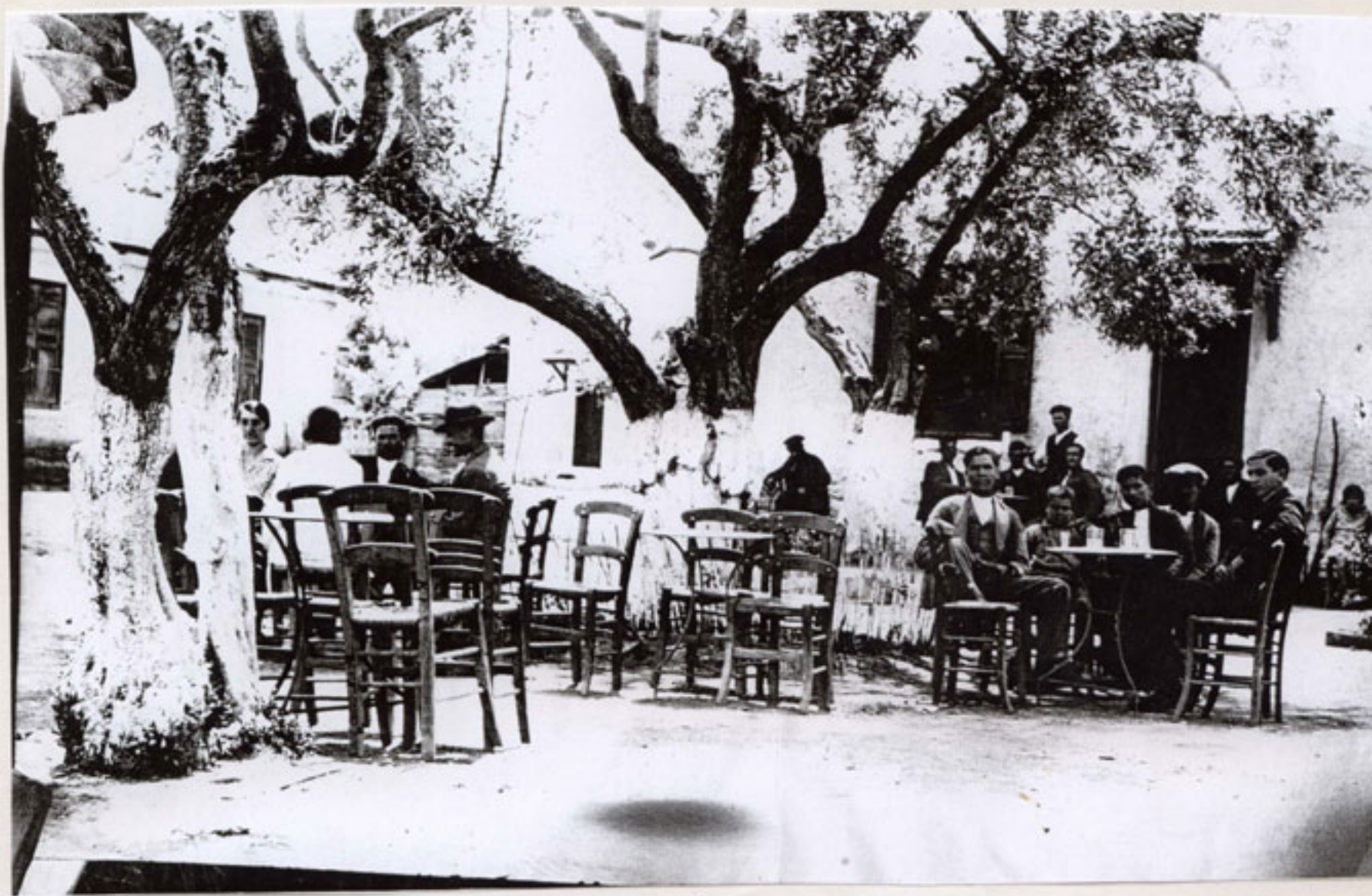
Η πλατεία του Αγίου Μελετίου – 1935