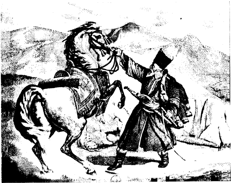
«Ένας Τάταρος και τα κομμάτια του λέοντα της Χαιρώνειας» Έργο L. Duprée (1819)